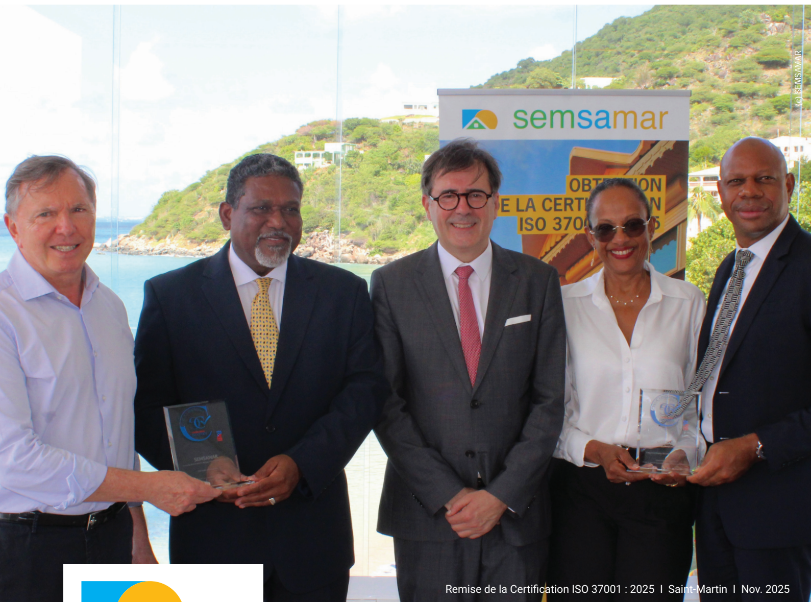
Remise de la Certification ISO 37001 : 2025 | Saint-Martin | Nov. 2025